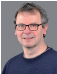
Herr Kaufmann KFZ-Mechatronik, Berufskraftfahrer; Schulverwaltung