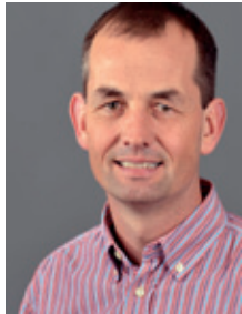
Herr Lammers Zweijährige höhere Berufsfachschule, Fachoberschule und Fachschule für Technik; zweijährige höhere Berufsfachschule Gestaltung