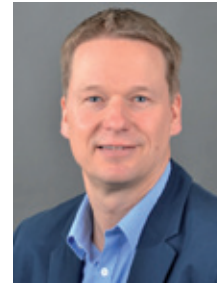
Herr Bokern Berufsschule: Metalltechnik, Mechatronik, Elektrotechnik